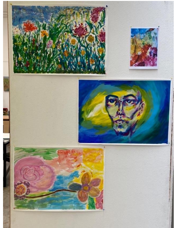
Flyer: "Tandem Malen" und einige der Produkte des gemeinsamen Malens vom 5.4.22 im Werkatelier der Stiftung Rheinleben.