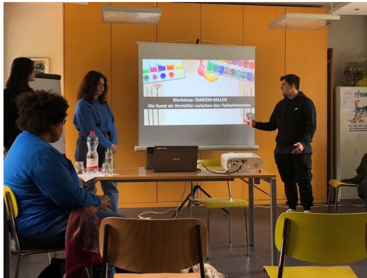
Schlusspräsentation vom 26.4.22 in der Tagesstruktur modular: mit Gästen, Mitarbeitenden und Klienten