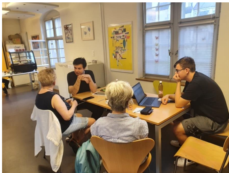
IT-Unterstützung im Café Modular am 19.4.22, Tagesstruktur der Stiftung Rheinleben.